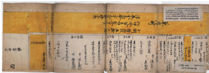
兼房町沽券図 [当館蔵]

今年度は、戦国時代から幕末期に至るまでの間、大名家に仕えた武家に伝わった中津川家文書、江戸時代の港区域にあった兼房町と飯倉町の町人が住む町屋敷地の形状や広さ、金額、持ち主などを記した沽券図が指定されました。