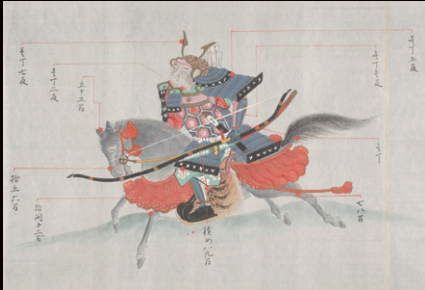
中津川家文書(砲術相伝絵巻) [慶應義塾図書館蔵] ※2月9日(金)までパネル展示、2月10日(土)から実物展示