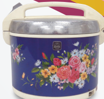
電子ジャー [当館蔵]