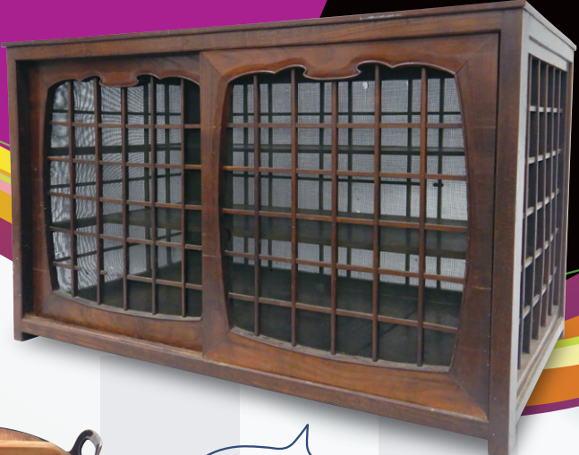
蟬帳(はいちょう) [当館蔵]