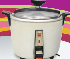
電気炊飯器 [当館蔵]