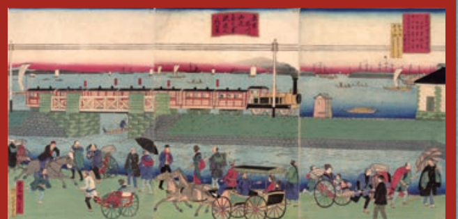
歌川広重(三代)「東京品川海辺蒸気車鉄道之真景」