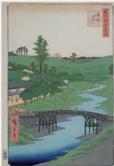
歌川広重(初代)「名所江戸百景 広尾ふる川」/歌川広重(二代)「諸国名所百景 東都青山百人町 星燈籠」