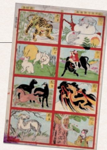
梅蝶「小児教育動物画」