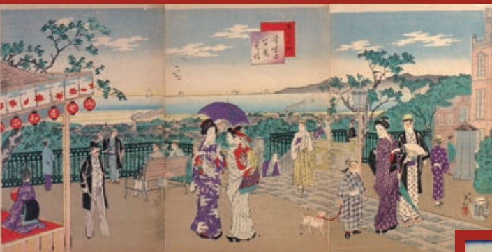
楊齋延一「東京名所 愛宕山公園見晴」