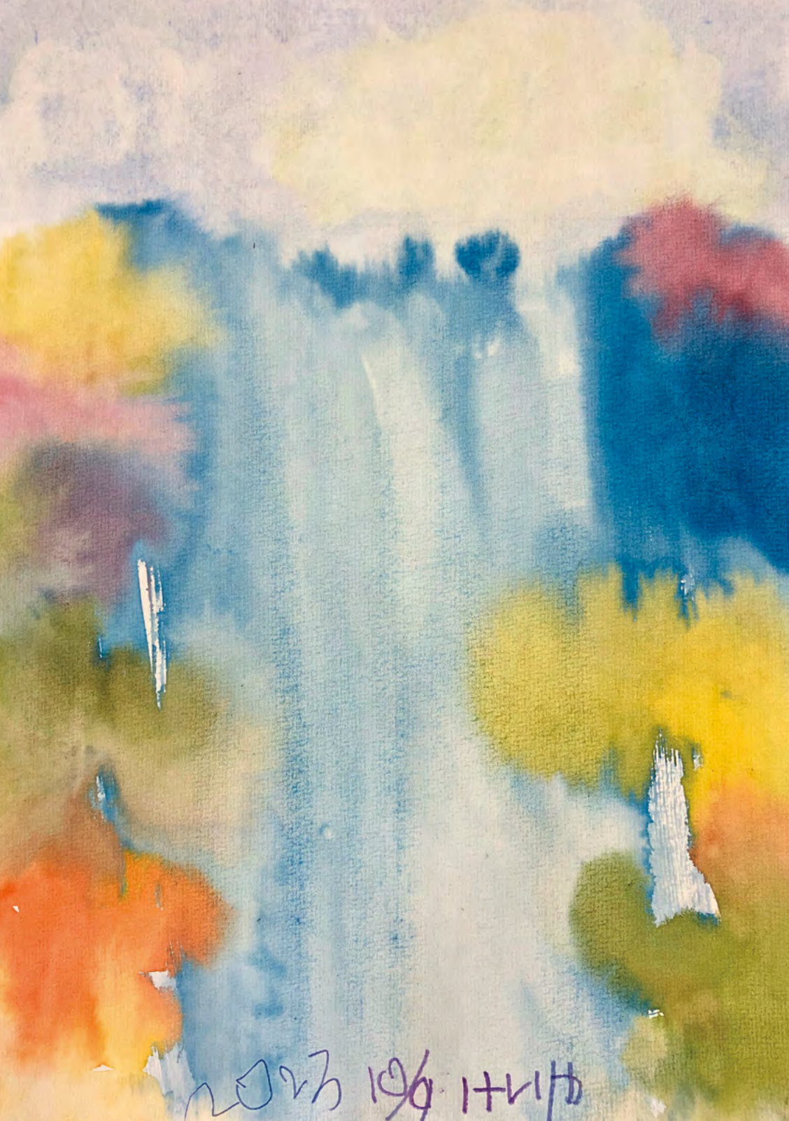
「滝」ハービー&マックローリン・陽だまり介護センターより