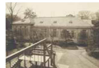
高輪・東宮御学問所(宮内公文書館蔵)