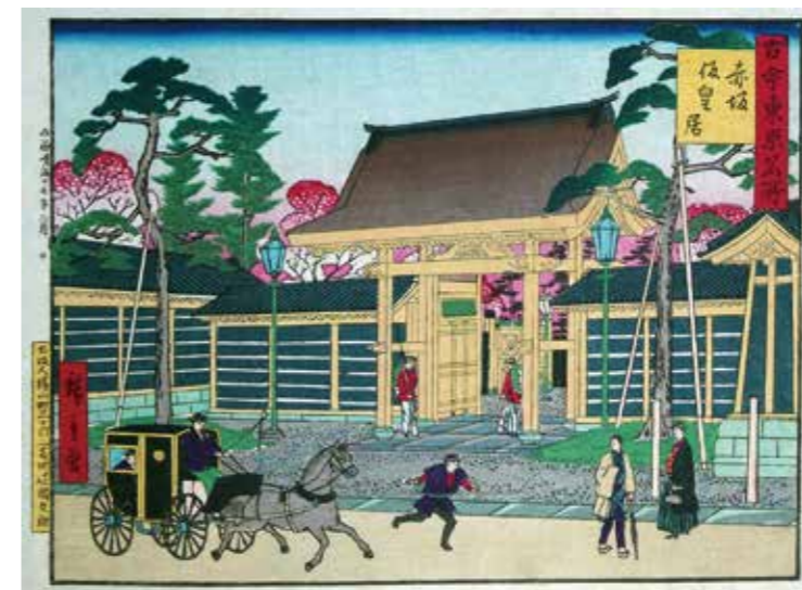
赤坂飯皇居[古今東京名所のうち] (当館蔵)