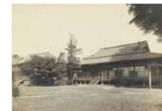
麻布御殿(宮内公文書館蔵)

明治～昭和戦前期の港区域には、皇居からほど近いこともあり、離宮や御殿、御用邸が置かれ、多くは皇族の住まいとして使われていました。赤坂離宮は観桜会や観菊会(現在の園遊会に相当)などの皇室行事に、芝離宮は諸外国からの賓客の接待のために使用されており、歴史の舞台ともなっていました。現在の港区域には、旧朝香宮邸や旧芝離宮恩賜庭園など、いまなお皇室との関係をうかがい知ることができる土地・施設の他に、麻布御殿や三田台町御料地など姿かたちがなくなってしまった場所も多くあります。本展では港区に残る近代皇室の痕跡を宮内庁宮内公文書館の史料を中心にひもとく、近代における港区と皇室の関係を紹介していきます。