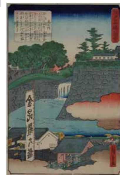
江戸名勝図会 虎の門(当館蔵)