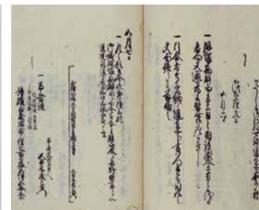
屋敷五方相对替一件控(当館蔵)

特別展の会期中、セット券での観覧者にクイズラリー用紙を配布します。武家屋敷を巡るクイズに答えた参加者全員に記念品を進呈いたします。