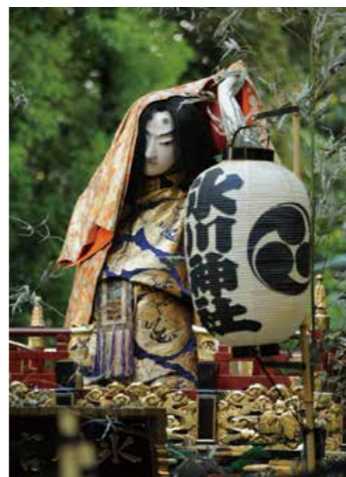
山車人形 日本武尊(NPO法人赤坂氷川山車保存会[赤坂新町五丁目町会]蔵)