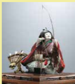
弓曳き童子(久留米市教育委員会蔵)

10月31日(日) ①午前10時~10時40分 ②午前11時30分~12時10分 ③午後1時30分~2時10分