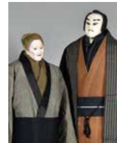
浄瑠璃人形(当館寄託)

未来への不安を取り除くため、切実な願いを叶えるために祈りを捧げる。それはコロナ禍の今も、そして昔も変わらない人の姿です。人が「人の形をしたもの」に願いを託したときに、人と人形(にんぎょう・ひとがた)の歴史は始まったといえます。縄文時代の土偶や古墳時代の埴輪にはじまり、古来より人の手によって作られた人形は、人とのかかわりにおいて多様に展開し、雛人形や五月人形などの節句人形、祭礼の山車人形、芝居の浄瑠璃人形など、日本独自の文化を形成しました。