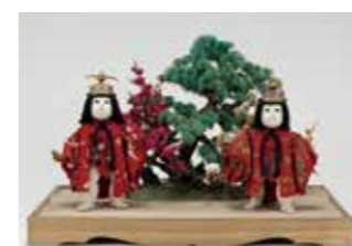
御台人形 鶴亀(吉徳資料室蔵)