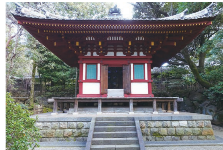
高輪プリンスホテル観音堂

港区は、歴史的環境に恵まれており、地域の歴史や文化を伝える多くの文化財が残されています。これらの貴重な文化財を永く後世に伝えていくため、毎年数件の文化財を指定しています。今回の「新指定文化財展」では、令和3年9月28日付で、今年度新たに加わった3件の指定文化財をご紹介します。