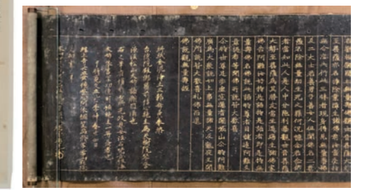
観無量寿経(増上寺所蔵浄土三部経)