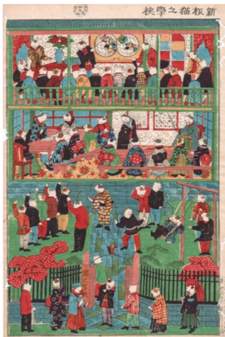
新板猫之學校 明治9(1876)年(個人蔵)