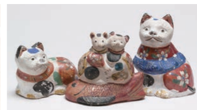
花巻人形 江戸時代末~明治時代前期(個人蔵)