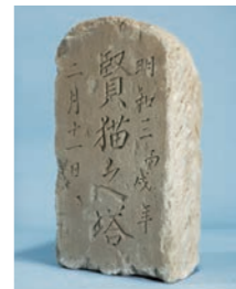
ネコの供養塔 伊皿子貝塚遺跡 江戸時代(当館蔵)

ネコの飼育頭数がイヌを上回ったという報道からもわかるように、現在、ネコを愛でる・飼育することが空前のブームとなっています。古くは弥生時代の遺跡からイエネコと思われる骨が出土していますが、ネコと人びとの関わりが密接になるのは江戸時代からでしょう。文献や浮世絵にはネコへの人びとの関心が垣間見えるほか、遺跡からはネコの供養塔が見つかり、丁寧に埋葬されたネコの骨が出土することもあります。一方で、化け猫伝説などが各地に残り、ネコと人びとの関係にはさまざまな側面があったようです。本展では、今年の干支であるネコ科のトラや、ネコと共に人びとの身近に存在するイヌにも対象を広げ、ネコやこれらの動物と人びとの関わり方の歴史を紹介します。