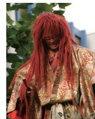
赤坂氷川祭の山車人形 狸々(しょうじょう)(赤坂氷川山車保存会蔵)