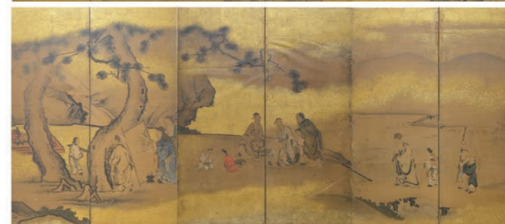
紙本着色琴棋書画図屏風(種徳寺蔵)【パネル展示】

港区は歴史的環境に恵まれており、地域の歴史や文化を伝える多くの文化財が残されています。これら貴重な文化財を後世に伝えていくため、毎年数件の文化財を指定しています。本展では令和4(2022)年10月に指定された新たな文化財を、パネルを中心に紹介し、地域の文化財と、その保護活動についての理解と関心を深めます。