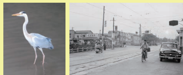
アオサギ

共催:港区立みなと科学館/港区立麻布地区公園・児童遊園 協力:入江誠(元国立天文台職員)