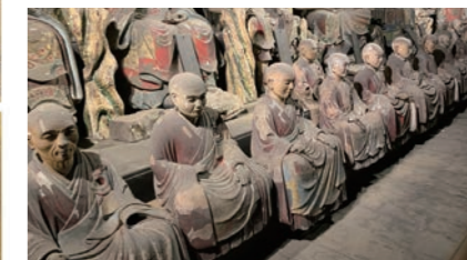
木造歴代人坐像(増上寺蔵)【パネル展示】

港区は歴史的環境に恵まれており、地域の歴史や文化を伝える多くの文化財が残されています。これら貴重な文化財を後世に伝えていくため、毎年数件の文化財を指定しています。本展では令和4(2022)年10月に指定された新たな文化財を、パネルを中心に紹介し、地域の文化財と、その保護活動についての理解と関心を深めます。