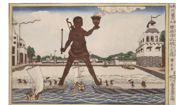
歌川国長「新版阿蘭陀浮画染徳海嶋銅人巨像」 文化(1804～1818)頃[当館蔵]

明治期に海外で活動した女性画家の洋画、初公開の肉筆画や版画、文学者との交流から生まれた美術、無形文化財保持者による工芸品など、もたらされた経緯をひもとくと、当館ならではの物語が見えてきます。さまざまな美術がひびきあう空間をお楽しみください。