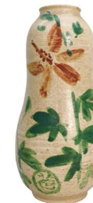
染焼花瓶 大正～昭和時代 永井荷風による絵付 [当館蔵]

当館では港区の歴史や文化に関わる資料を収集しています。このたびは館蔵品の中から、港区で活躍した芸術家の作品や港区ゆかりの方々から寄贈された作品など、選りすぐりの美術工芸品を紹介いたします。