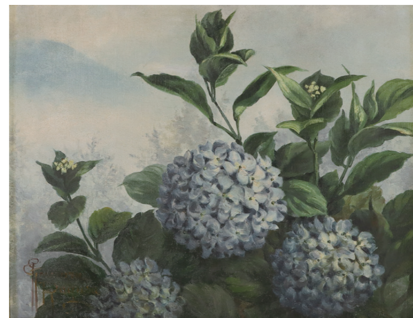
ラゲザ玉「紫陽花図」 昭和8～14(1933～1939)年[当館蔵]