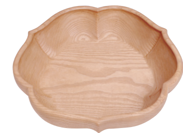
桐木地六弁盛器 昭和～平成時代 中臺瑞真(重要無形文化財保持者) [当館蔵]